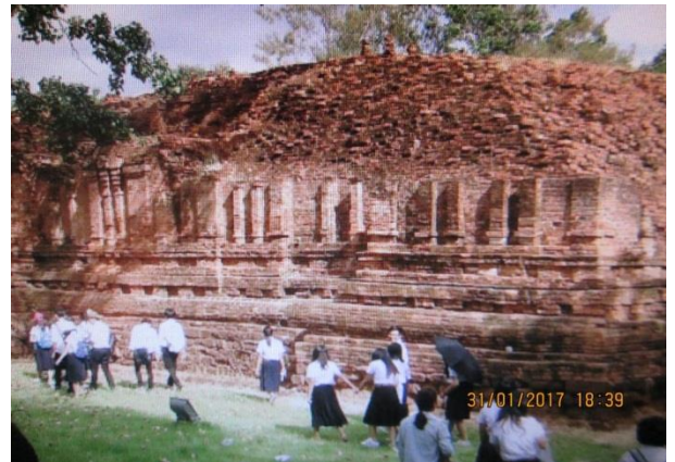
/๘.วัดโขลงสุวรรณคีรี...